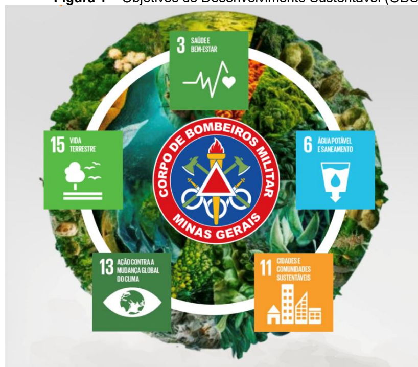
Figura 1 – Objetivos de Desenvolvimento Sustentável (ODS)

O Corpo de Bombeiros Militar de Minas Gerais está alinhado com a Agenda 2030 da ONU, comprometendo-se com os Objetivos de Desenvolvimento Sustentável (ODS), vide Figura 1.